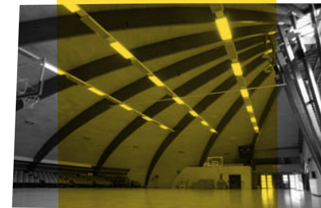
de 'Expo hal' in Deurne was in '58 één helft van het houtpaviljoen