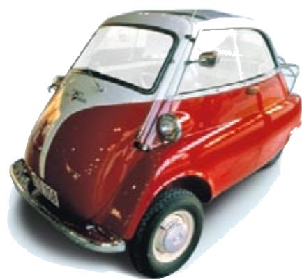
de BMW Isetta