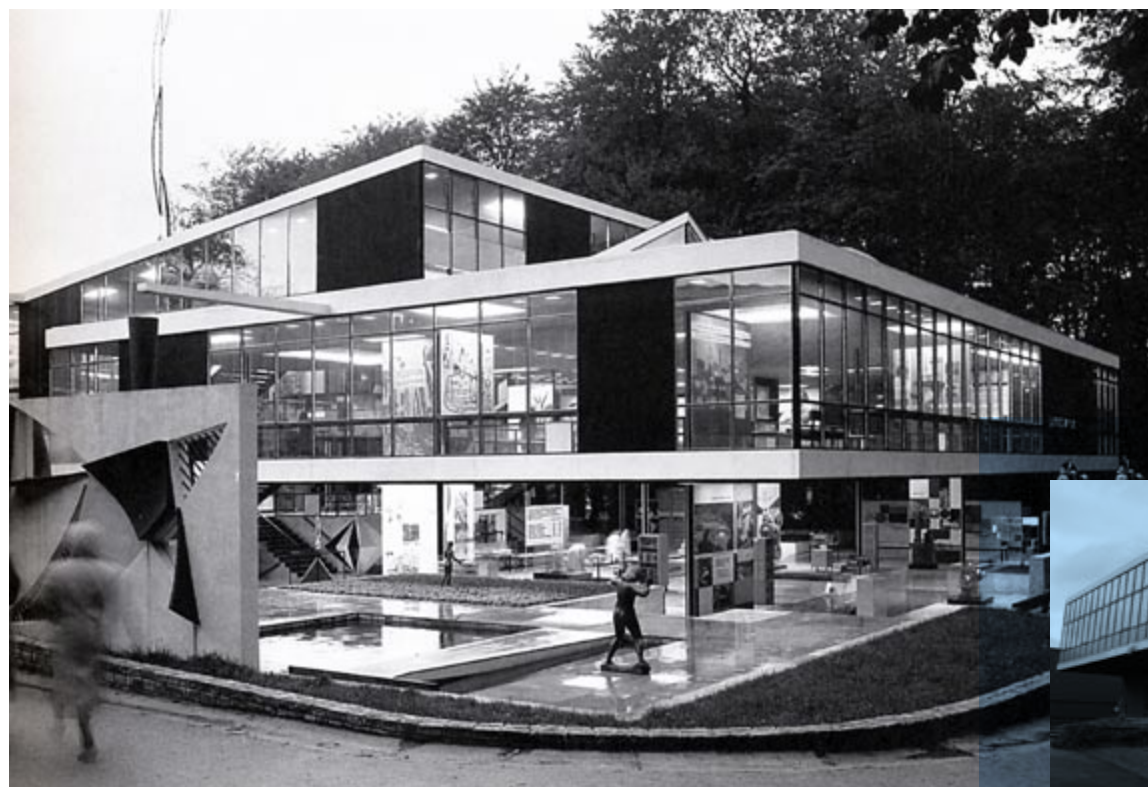
het Joegoslavische paviljoen vroeger...