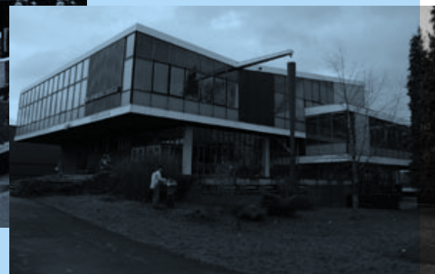
... en nu