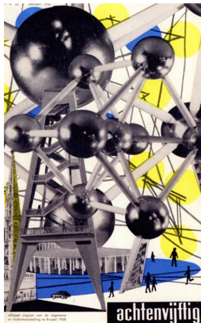
cover van het tijdschrift 'achtevijftig'

Meer lezen over de architectuur op Expo '58? Moderne architectuur op Expo 58 (Rika Devos/Mil De Kooning) (2006, uitg. Mercatorfonds en Dexia Bank)