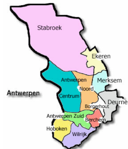
Het dekenaat Antwerpen met de verschillende federaties

der te zetten, ook zonder wijding. Want wat betekent die wijding? Wij zijn toch ook toegewijd?’ ( lacht )